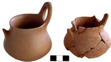
Εικ. 217: ΑΘΒ 506 και αναπαράσταση.