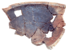
Φωτ. 178: Δοκίμιο-επίγραμμα-πορσελάνη