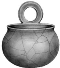
Σχ 29: ΑΘΒ 505