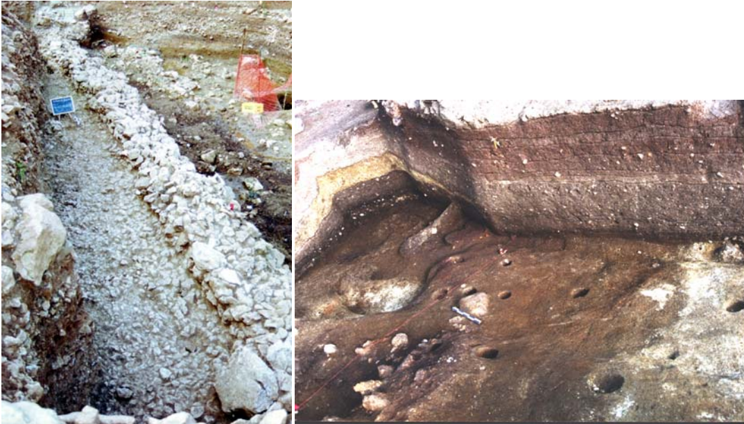
Κρανιά: Ο περίβολος στον λόφο του Κάστρου και εργαστηριακοί χώροι