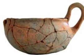
Εικ. 218: ΑΘΒ 507.

Πηγή Αθηνάς, νεκροταφείο τύμβων Εποχής Χαλκού