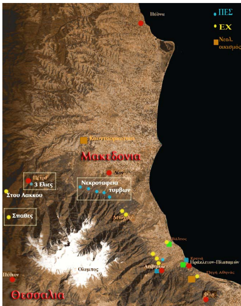
Η περιοχή του Μακεδονικού Ολύμπου