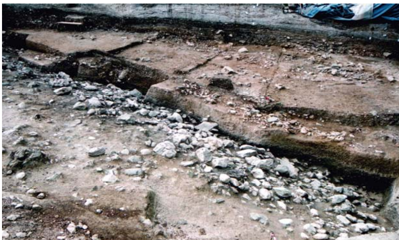
Εικ. 351 : Στρώμα 19, Περίβολος Υπερκείμενες οικοδομικές φάσεις