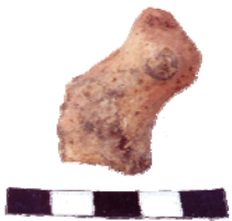
Φωτ. 177: Ξημένο ζωογάδο υπεύθυ