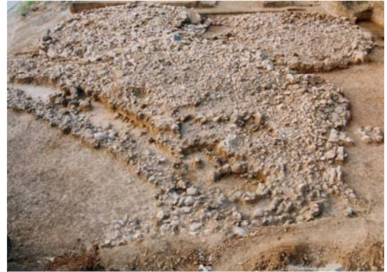
Εικ. 159: Νεκροταφείο τύμβων.