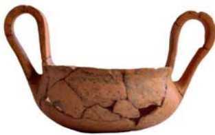
Εικ. 183: ΑΘΒ 1452.