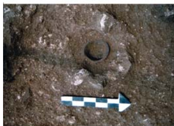
Εικ. 344 : Στρώμα 13, οικοδομικά κατάλοιπα και αγγείο in situ