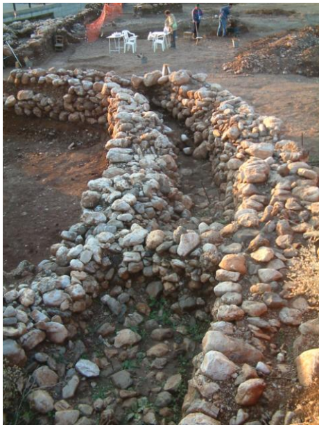
Εικ. 6: Περιβόλοι 2 & 3.