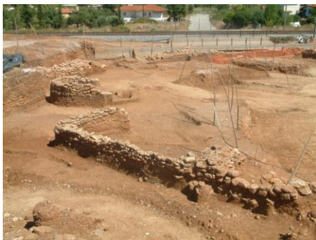
Εικ. 8: Κτήριο δύο χώρων.