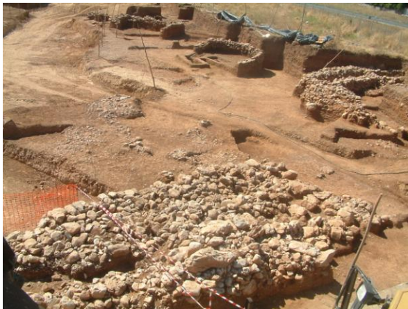
Εικ. 1: Γενική άποψη της ανασκαφής. Σε πρώτο πλάνο το κτήριο σχήματος Π και στο βάθος οι Περίβολοι 2 & 3, ο Ταφικός Τύμβος 1 και το δίχωρο κτήριο.