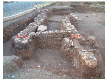
Εικ. 2: Κτήριο Α.