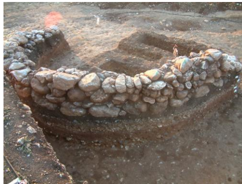
Εικ. 9: Ταφικός Τύμβος 1.