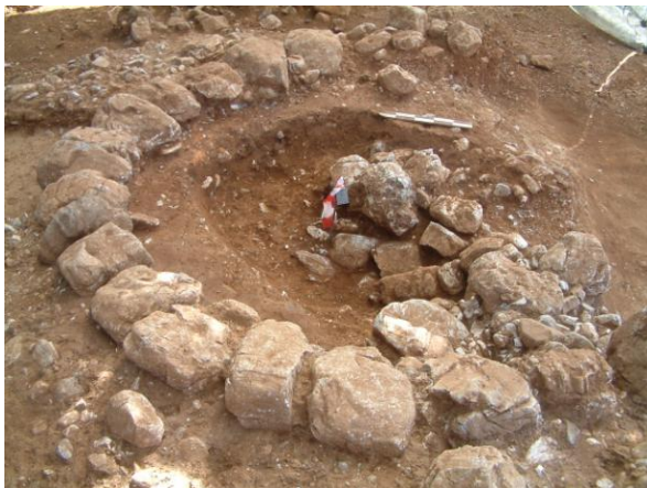
Εικ. 3: Ο Ταφικός Τύμβος 2 με την Ταφή 5.