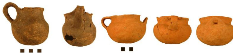
Εικ. 5: Ταφή 5. Μόνωτο κύπελλο και φιάλη.