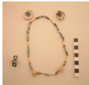
Εικ. 4: Κτερίσματα Ταφής 5.