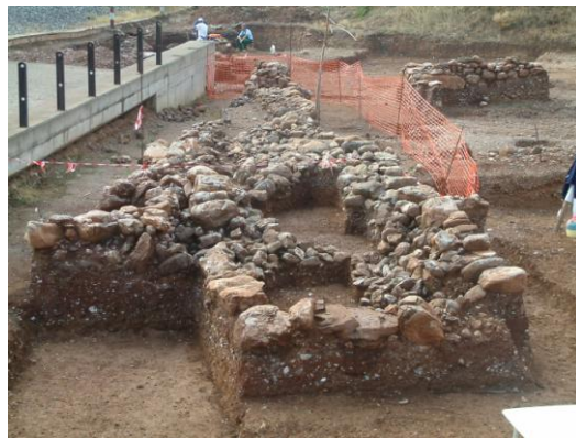
Εικ. 7: Κατασκευή σχήματος Π.